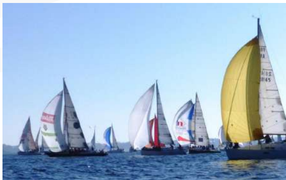
Régate des IUT 15è Edition

Depuis 2004, la Régate des IUT réunit des équipes de toute la France autour de la voile, avec deux challenges passionnants : le challenge voile et le challenge communication.